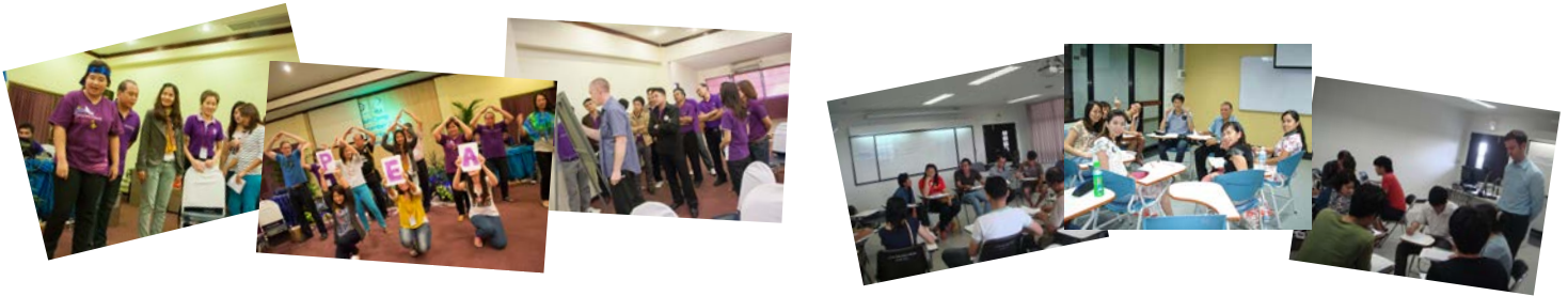
โครงการค่ายภาษาอังกฤษ (English Camp) สำหรับบุคลากรการไฟฟ้า