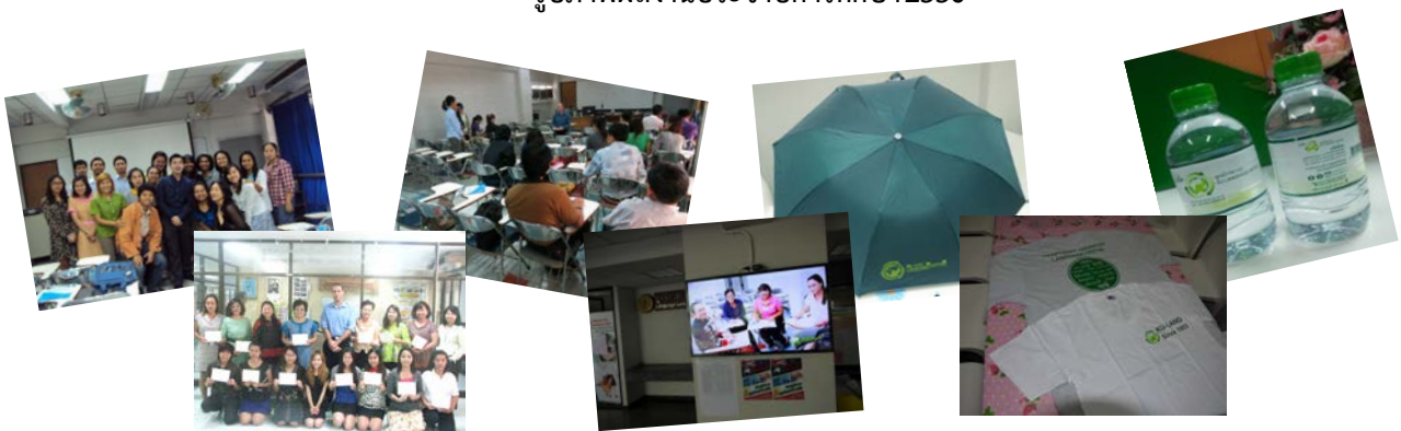
* รูปภาพผลงานประจำปีการศึกษา 2556 *